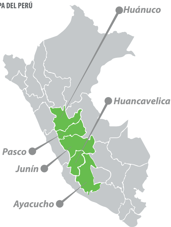
MAPA DEL PERÚ